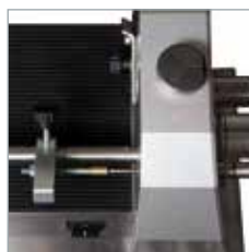
Seleciona o comprimento do corte