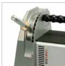
Afia o eletrodo no ângulo desejado