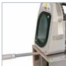
Ajustamento preciso do stick-out