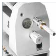
Corta o eletrodo quando se gira a alavanca