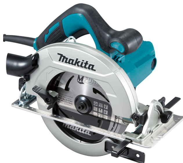
360° Imagem 360°