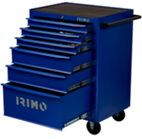
Carrinho de ferramentas 26" com 6 gavetas 9066K6