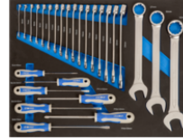
Inserções de espuma 3/3 com chaves de bocas combinadas e chaves de parafusos - 27 pcs IFF1A003