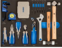
Inserções de espuma 3/3 com martelos, alicates e pontas - 85 pcs IFF1A002